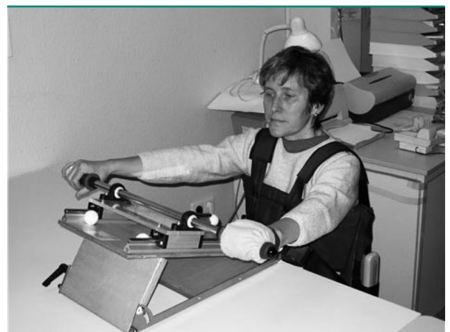
Abb. 1: Mechanischer Armtrainer »Das Nudelholz«, eine Patientin mit Hemiparese links und schwerer Armparese trainiert eine drei-dimensionale Bewegung, der Brustgurt verhindert eine kompensatorische Rumpfbewegung

Die Abbildung (Abb. 1) zeigt einen beispielhaften Patienten mit einer hochgradigen Armparese links, der lediglich die Schulter minimal anheben, den Ellenbogen im Muster und die Finger gering beugen konnte. Die Hand- und Fingerstrecker dagegen waren plegisch. Der distale Tonus war schlaff bzw. für das Ellenbogengelenk minimal gesteigert entsprechend einem modifizierten Ashworth Score (0–5)